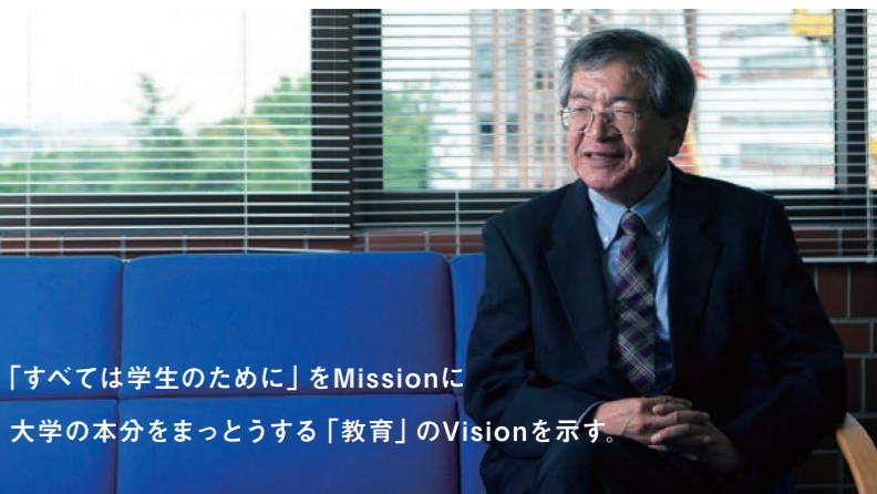
「すべては学生のために」をMissionに大学の本分をまっとうする「教育」のVisionを示す。

学生によって理解度に差があることは当然なのですが、教育者の多くはそのことを見落としてしまいます。「なぜ理解できないのか、それが理解できない」と、なりがちで、