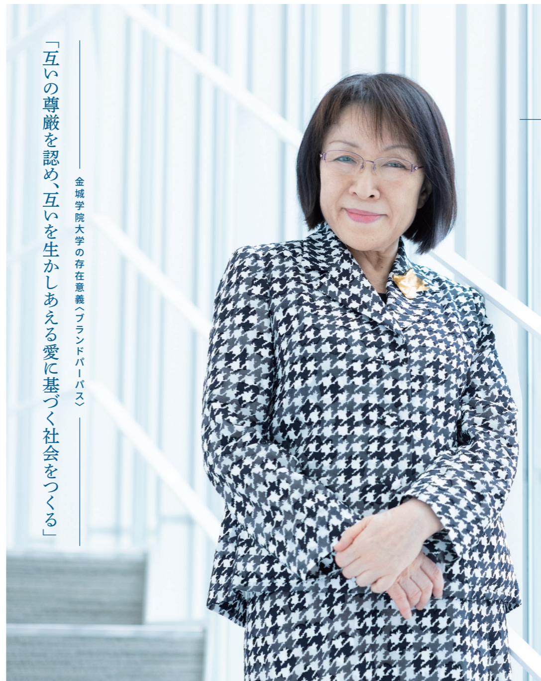
金城学院大学の存在意義（ブランドパーパス）

昨年度は、何と言っても新型コロナウイルス対策が最優先事項でした。2020年2月に新型コロナウイルスへの対策を検討するチームが発足され、4月には学生や教職員の安心・安全を担保するため、授業のオンライン化などを進めました。多くの先生方や職員のお力により、マニユ